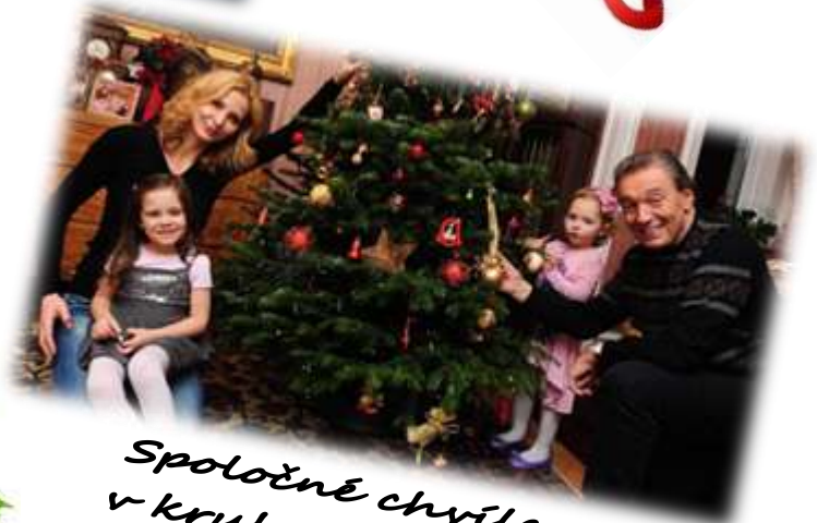
Spoločné chvíle v kruhu rodiny